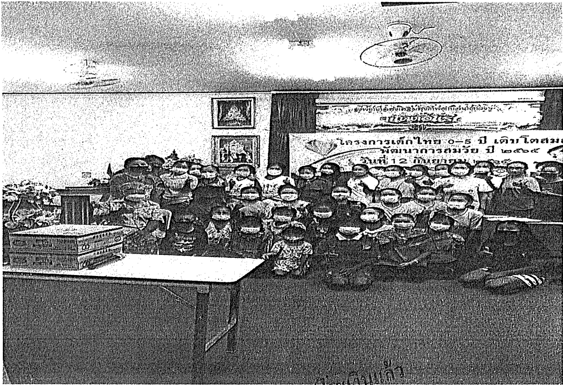
ถ่ายภาพแล้ว