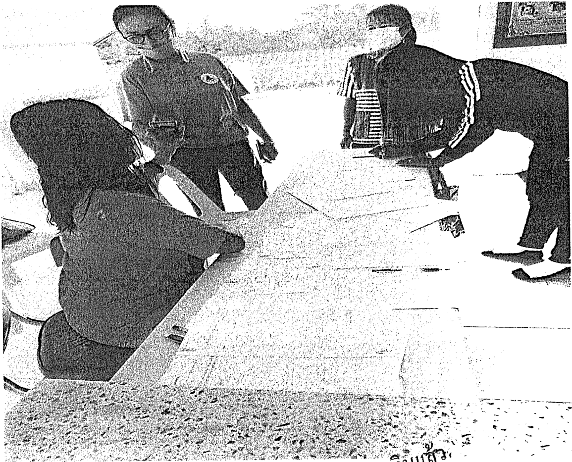
จ่ายเงินแล้ว